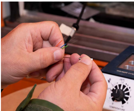
Konfektion der Einzelferrulen