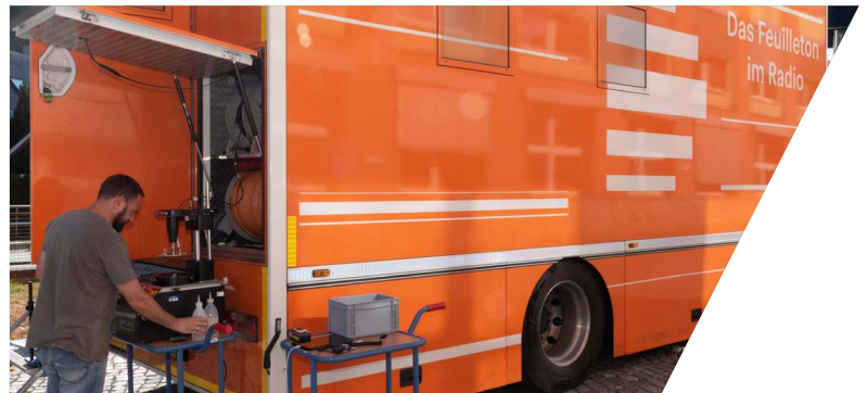
Reparatur der fest verbauten Strecken