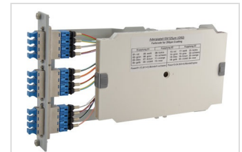
URM-Spleißmodul Seite 2