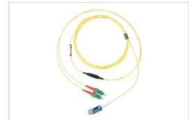
Uniboot-Duplexpatchkabel mit flexiFanout Duo