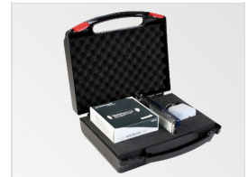
Reinigungskoffer Basic geöffnet