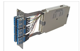
Kompaktspleißmodul Twin LC