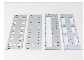
Frontplatten 8 TE