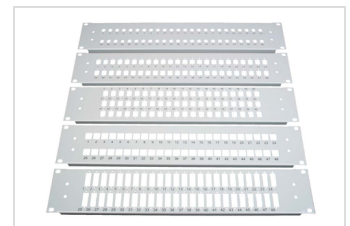
2 HE Frontplatten