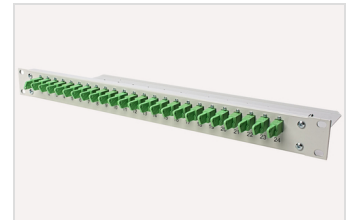
1 HE Verteilerfeld, E-2000 Kupplungen