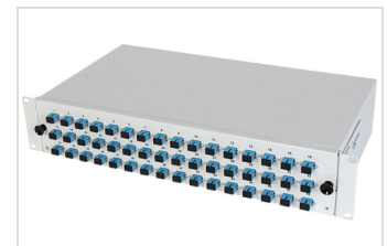
2 HE Spleißschublade Modell E, geschlossen