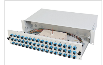
2 HE Spleißschublade Modell E, bestückt