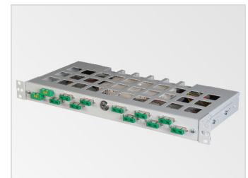
1 HE Spleißschublade, bestueckt, geschlossen