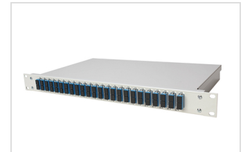
1 HE Spleißbox