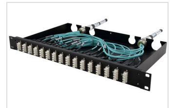
19" LWL Patchbox zum Festeinbau - offen