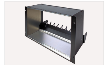
Baugruppenträger modular 6 HE, mit Trunkkopfabfangung