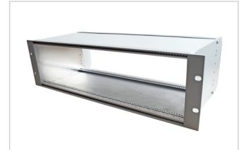
Baugruppenträger 3HE RAL7035